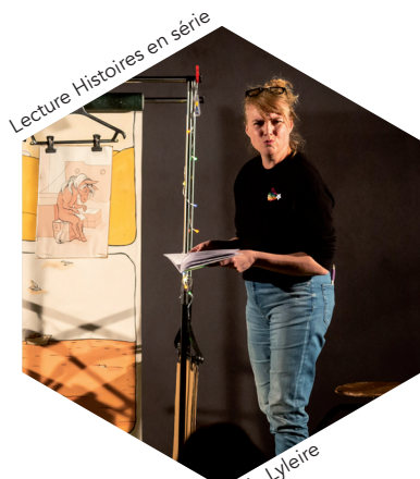
Lecture Histoires en série