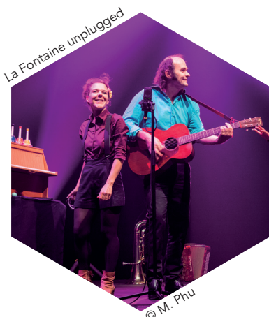
La Fontaine unplugged