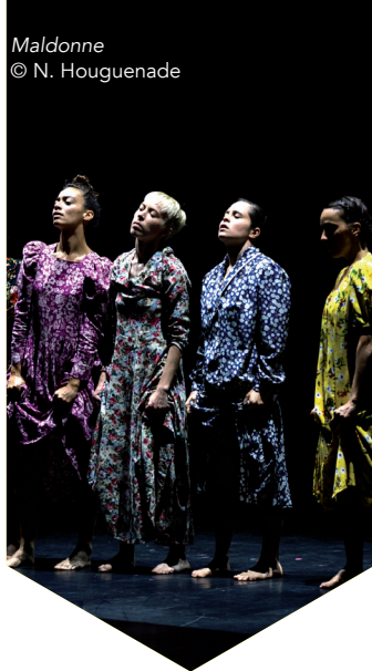
Maldonne © N. Houguenade