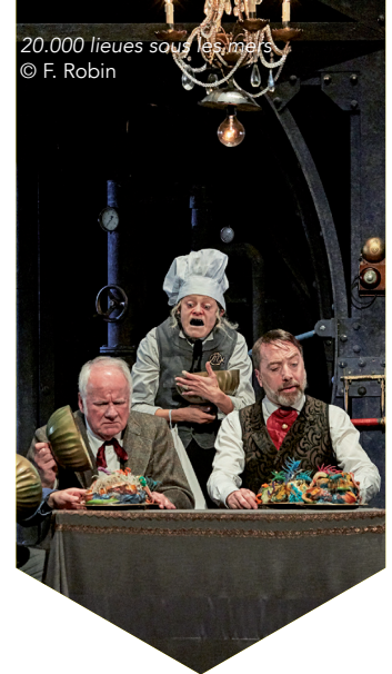
20.000 lieues sous les mers