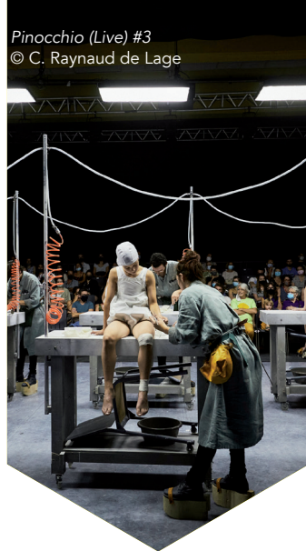
Pinocchio (Live) #3