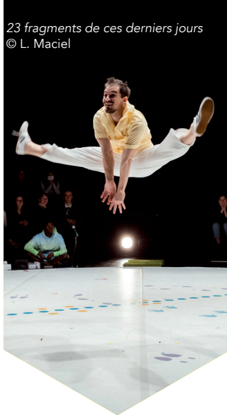
23 fragments de ces derniers jours