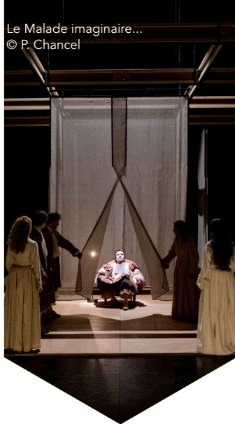
Le Malade imaginaire...